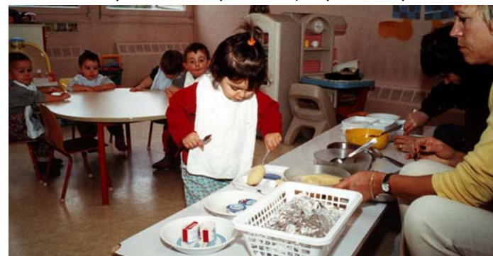
Le « libre-service » de la crèche du CHU

Pour maîtriser ces problèmes, nous avons mis en place dès 1999 une collaboration entre des chercheurs de Flavic (INRA) et un pédiatre du CHU. Nous avons ainsi pu mettre à profit des observations réalisées dans un « libre-service » de crèche, mis en place initialement pour rendre le repas du midi plus ludique pour les petits.